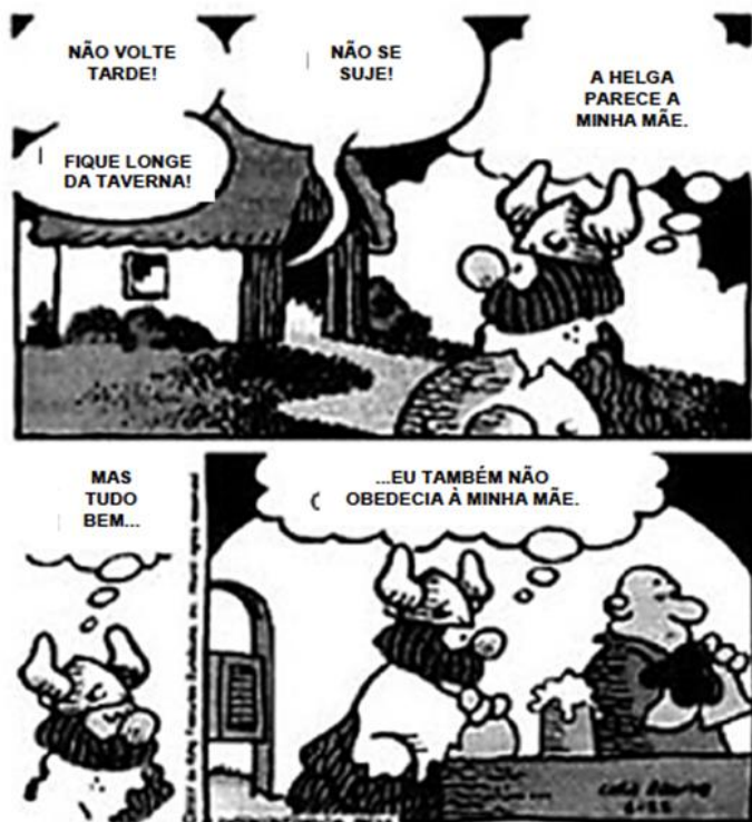
EVEDO, Alvares de Hagar, o Horrível, Dick Brownw, L&PM. Adaptado)